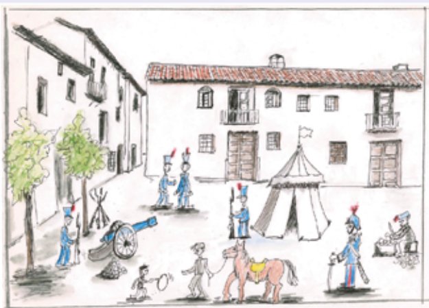
Autor del dibuix: Rodolfo Pardo Vera, recreant la imatge de la plaça Nova, actual plaça de Colón

"Esta villa tiene 2.437 habitantes, está a una distancia de 23 kilómetros de Valencia, comunicándose con esta capital por medio de la carretera de Mislata a Real de Montroy. Tiene además otra carretera que conduce a Silla y cuenta con varios caminos vecinales, siendo sus datos estadísticos principales los siguientes:"